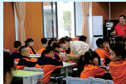
工作室学员开展“同课异构”课堂教学活动