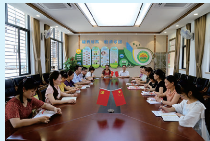
工作室成员集中研修活动