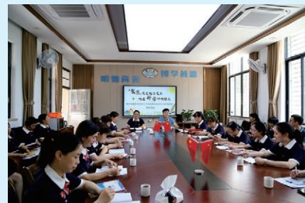
工作室携手区域学校开展联盟研修活动