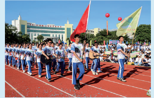
活力十足的田径运动会

慧雅教育铸品质，同心筑梦向未来。学校将以集团化办学为契机，践行“守正创新，慧雅臻美”的办学理念，致力于培育“慧思雅行、自信尚美”的“慧雅少年”，打造“慧心立己、雅志达人”的“儒雅教师”，办一所让人幸福成长的学校。