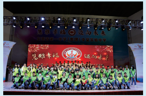
丰富多彩的校园艺术节

创设多元发展的平台。目前，学校已开发了“工雅景泰蓝”“成和健美操”“清韵陶笛”“印象中堂”“科技创新”等50余门系列特色课程。