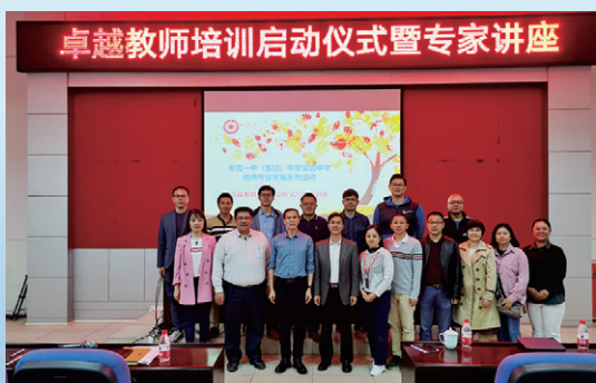
“卓越教师”培训启动仪式

浩荡东江，德本中堂；幸福品质，慧雅铸造。坐落在龙舟之乡的东莞市第一中学（集团）中堂实验中学，犹如一朵高雅清丽的幸福之花，在莞邑大地上烂漫绽放。