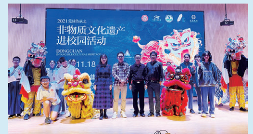
“非遗文化进校园”活动