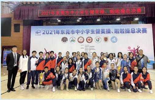
学生在东莞市中小学生健美操总决赛中勇创佳绩