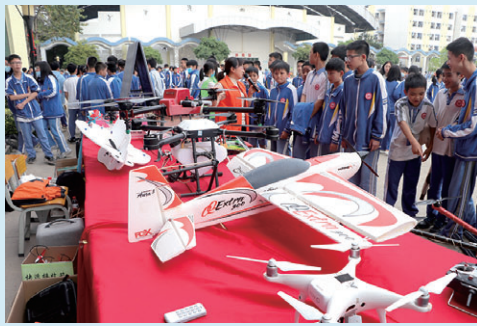
创意无限的科技节活动