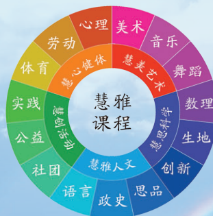
“慧雅课程”体系结构图

打造特色，开发“慧雅课程”体系。 学校以发展学生核心素养为中心，从实际出发，将国家课程、地方课程、校本课程有机融合，进行横向拓展与纵深发掘，构建了层次清晰、递进有序、开放有致的涵盖“三级五维”的“慧雅课程”体系；在课程改革与设计不断求索创新，精心构建了“慧雅人文、慧思科学、慧美艺术、慧心健体、慧创活动”等课程；增加课程的多样性和选择性，发挥教师优势，发展学生特长，为学生