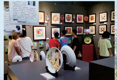
学校景泰蓝画展厅