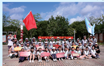
学校师生参加党史学习教育实地研学活动