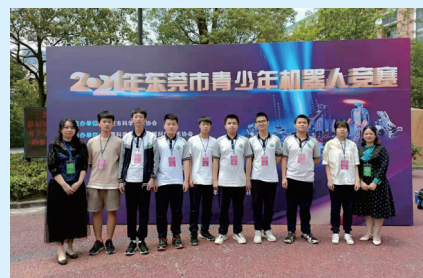
学生在2021年东莞市青少年机器人竞赛中获得第一名