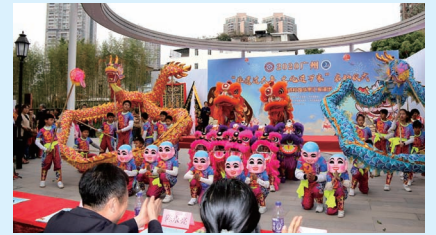
学校醒狮队参加2020广州“非遗过大年，文化进万家”启动仪式暨非遗醒狮进校园成果汇报演出，展现“非遗”新活力