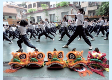
融合了南拳、洪拳的大课间武术操