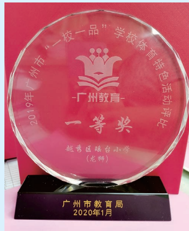
学校在2019年广州市“一校一品”学校体育特色活动评比中获得一等奖

传承文化，硕果累累。 舞龙舞狮项目已成为瑶台小学的一张闪亮名片，学校醒狮队多次应邀参加越秀区广府庙会的演出，在省、市级比赛中屡创佳绩。学校的“龙狮”融合大课间活动在广州市“一校一品”体育特色活动评比中获得一等奖。2020年1月14日，2020广州“非遗过大年，文化进万家”启动仪式暨非遗醒狮进校园成果汇报演出在荔湾永庆坊盛大举行，学校醒狮队参与现场演出，精彩展现“非遗”新活力。