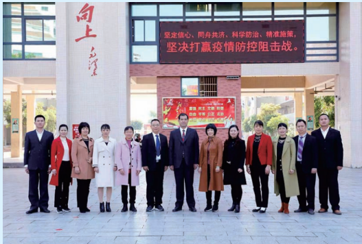
团结务实的行政领导班子

展望未来,任重道远。五华县第五小学教育集团将承载着每一位孩子的青春梦想,致远创新,扬帆远航。