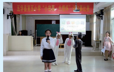
“小故事·大情怀”讲故事比赛