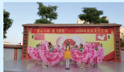
精彩纷呈的元旦文艺汇演