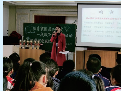
“书香家庭,亲子阅读”交流暨颁奖活动