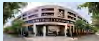
集团高中部校区外景